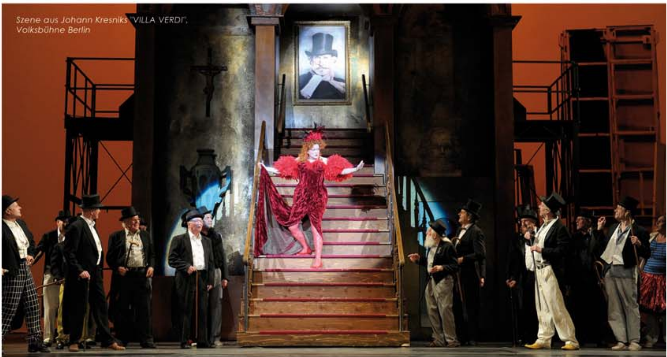
Szene aus Johann Kresniks „VILLA VERDI“, Volksbühne Berlin