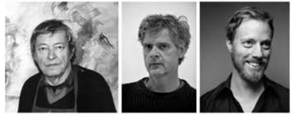
Fotos: Hans Vent: „Schreitender“, Öl auf Leinwand, Foto: Bernd Kuhner. Portrait: Renate Zein Hans Aichinger: „Der Anarchist“, Öl auf Leinwand, courtesy maerzgalerie. Fotos: maerzgalerie Wolfgang Flad: „Arm“, Foto: Studio Wolfgang Flad. Portrait: Yves Sucksdorff Szenefoto aus „VILLA VERDI“: Thomas Aurin